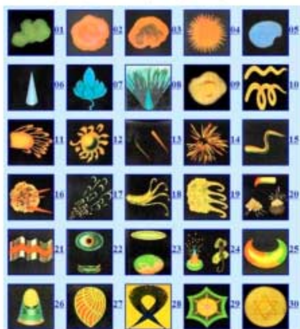
Gedankenformen in der Aura von Personen aus dem Buch von Charles W. Leadbeater und Annie Besant „Gedankenformen“

Leadbeaters „Gedankenformen“ finden sich online in: http://www.paranormal.de/paramim/gedanke/form.html